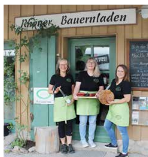
Bauernladen Fladungen Bahnhofstraße 19 97650 Fladungen