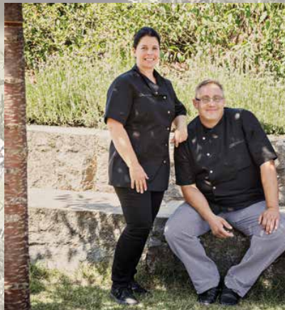
34–39 Guten Appetit!