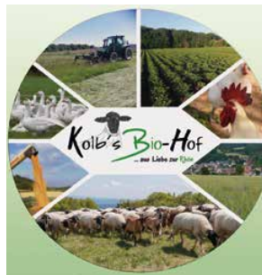
Kolb's Bio-Hof Friedhofsweg 4 97656 Oberelsbach-Ginolfs

Ob aromatischer Käse, frisches Brot oder würziger Honig – in den Bauernläden der Direktvermarkter erhalten Sie hochwertige Produkte direkt vom Erzeuger. Hier schmecken Sie, was die Rhön ausmacht: Natürlichkeit, Handwerk und Liebe zur Heimat. Ein Besuch lohnt sich – für Genießer und alle, die wissen wollen, woher ihre Lebensmittel kommen.