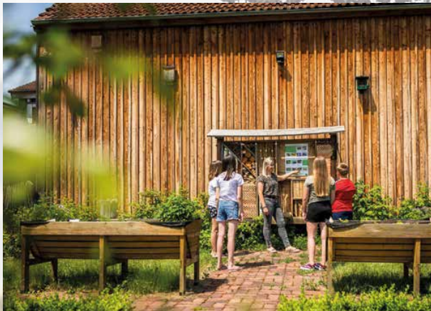
10–17 Unsere beliebtesten Bildungsmodule