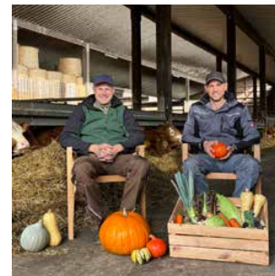
Biohof Hartmann Herrenwiese 21 97656 Oberelsbach-Weisbach