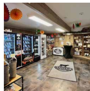
Mangers Bauernladen Marktstraße 9 97656 Oberelsbach