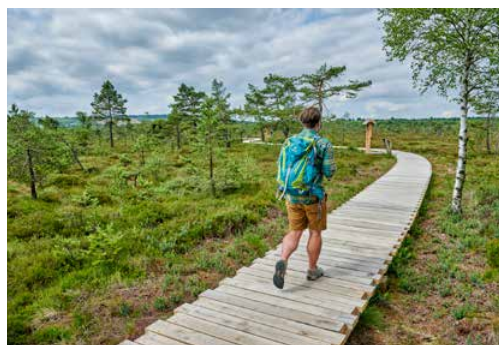
Frickenhäuser See

Erfrischung gefällig? Einige Rhöner Seen laden auch zum Baden ein. Mehr erfahren Sie hier!